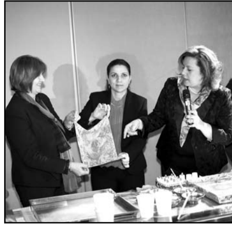
ayırı bir salonda türk milli imeklerinän tanışmaa hem imek verildi.

Söleyerek bu günkü toplantı için, Canabisi kısıdan annatı “Edru” incizanaatı için hem teklif etti herkezi kim isteeri, kendi elinnän yapsın kendi resimini. “Ebru” gösterisindän sora, salonda toplanan insannara teklif edildi