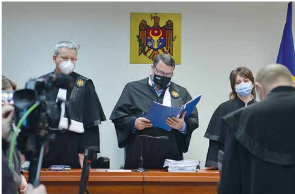
Moldova Baş prokuroru Aleksandr STOYANOGLU hakkında karar alacak daavacıların diştirilmesi için danışmayı inceleyän hem bu uurda yarı karar alan Apelätiya Palatasının daavacıları.