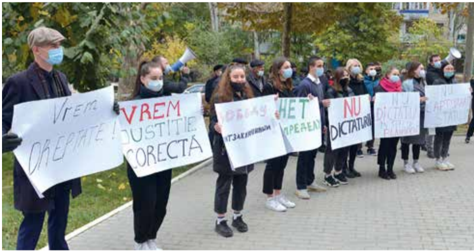
Baş prokuror Aleksandr STOYANOGLU serbest brakılması için Kışinev Apelätiya Palatasının önündä protest mitingü.

dosye kurdu, sudun sekretarinnän bilä, başladı presayı salondan kuuma. Bundan annadık, ani bu sudta da dooruluk bulunmayacak. Ölä da oldu.