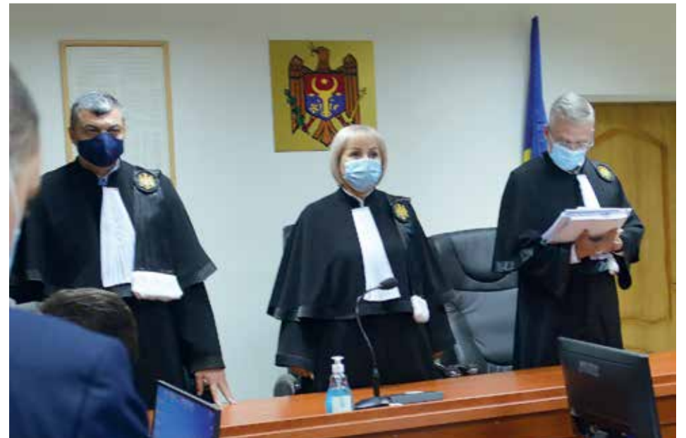
Moldova Baş prokuroru Aleksandr STOYANOGLUNun davasını inceleyän Kışinev Apelätiya Palatasının daavacıları, ayrı bir erdä aralarında bir saatlik konuşmadan sora, hepsinä ilerdän bilinän kararı açıkladılar.